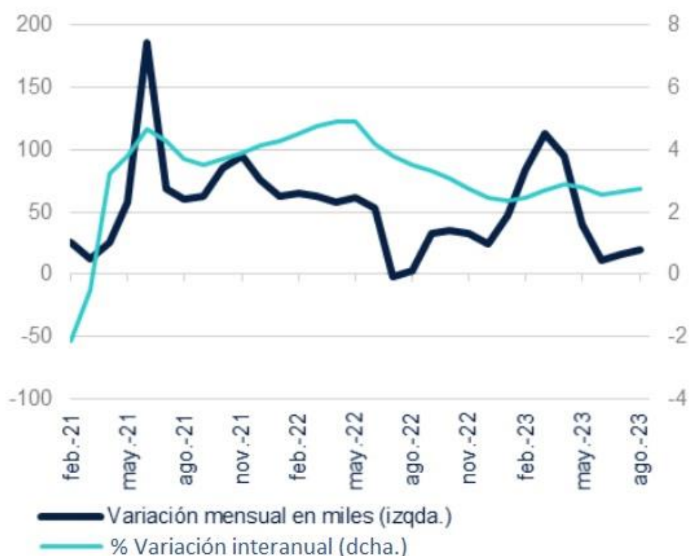
Gráfico 1. Evolución de la afiliación media a la Seguridad Social (febrero 2021-agosto 2023)

126. - En base al gráfico 1, podemos afirmar que: